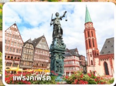
แฟรงค์เฟิร์ต

ฝรั่งเศส เบลเยียม ลักเซมเบิร์ก เยอรมนี เนเธอร์แลนด์ 8วัน 5คืน