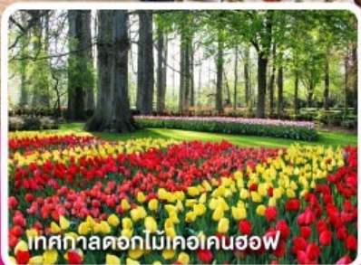
เทศกาลดอกไม้เคอเคนฮอฟ