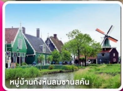
หมู่บ้านกังหันลมซานสคิน