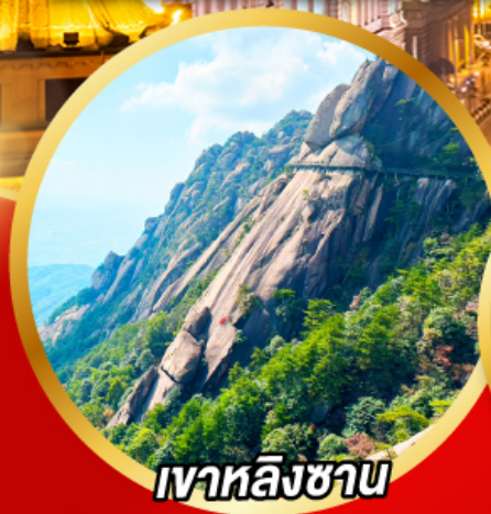
เวาหลิงซาน