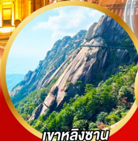
เขาหลิงซาน