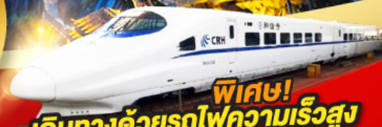
พิเศษ! เดินทางด้วยรถไฟความเร็วสูง