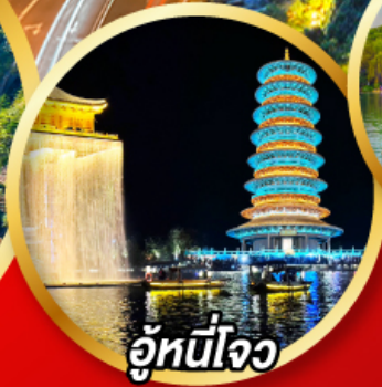
อู่หนี่โจว