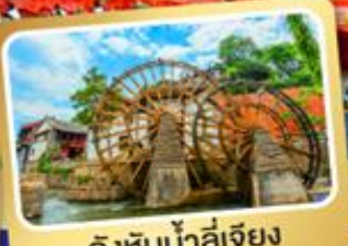
กังหันน้ำลี่เจียง