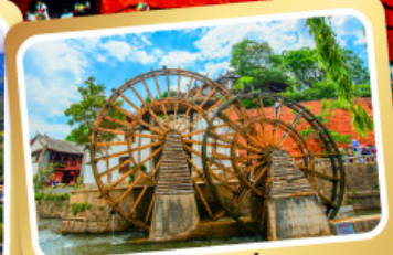
กังหันน้ำลี่เจียง