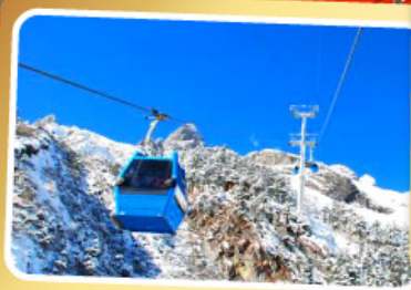
กระเช้าใหญ่ขึ้นภูเขาหิมะมังกรหยก