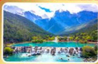
หุบเขาน้ำเงินทะเลสาบโป๋สุยเหอ