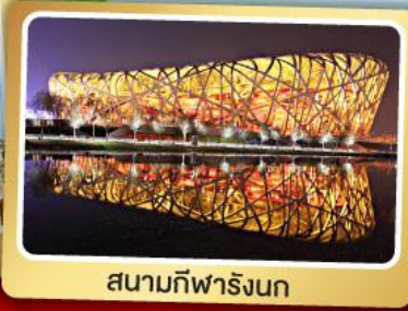
สนามกีฬาวิงนก