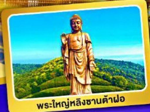
พระใหญ่หลิงซานต้าฝอ