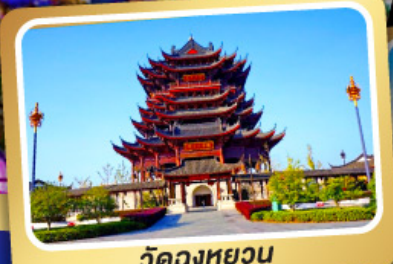
วัดดวงหยวน