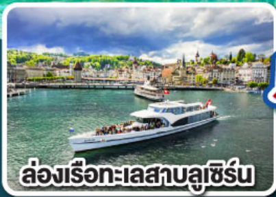
ล่องเรือทะเลสาบลูเซิร์น