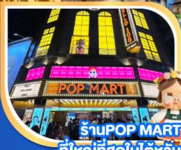
ร้าน POP MART ที่ใหญ่ที่สุดในโลก