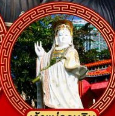
เจ้าแม่กวนอิม รaffles เบย์