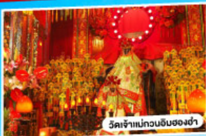
วัดเจ้าแม่กวนอิมของง่า

*นั่งรถข้ามสะพานเซินเจิ้น-จงซาน "สะพานข้ามทะเลที่สูงที่สุดในโลก"