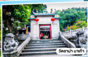
วัดอานา มาเก๊า