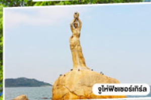
จูไห่พิซเซอร์เทิร์ส