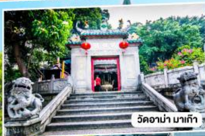
วัดอามาเก๊า