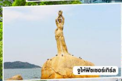
จูไห่พีชเชอร์เกิร์ล