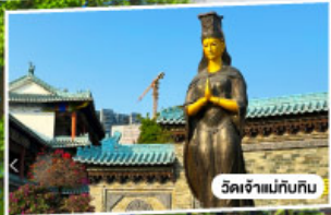
วัดเจ้าแม่กวนอิม