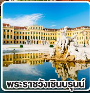
พระราชวังเซินบรุนน์

บินตรงไปกลับ ด้วยสายการบินชั้นนำระดับ 4 ดาว คูปองท์อันซ่าและออสเตรียนแอร์ไลน์