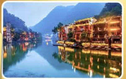
เมืองโบราณฟิ่งหวง