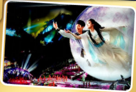
โชว์จิ้งจอกขาว