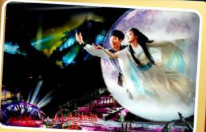
โชว์จิ้งจอกขาว