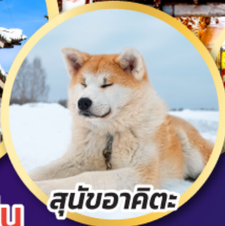
สุนัขอาคิตะ