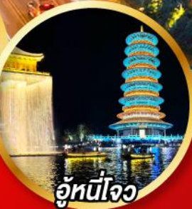
อุ๋หนี่โจว