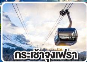
กระเช้าจุงเฟรา