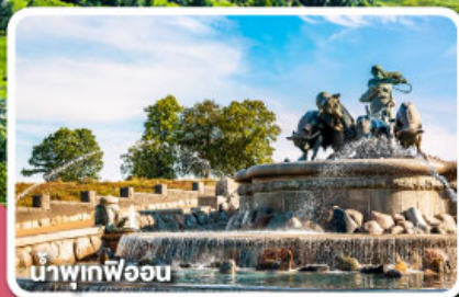
นาวิกพิธีอน

เรือสำราญบานุกทึยและรถไฟสายโรแมนติก สวีเดน นอร์เวย์ เดนมาร์ก 8 วัน 5 คืน