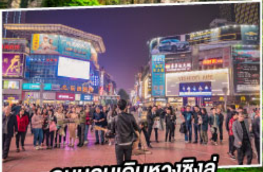
ถนนคนเดินหวงชิ่งอู่