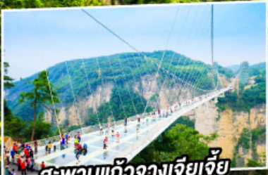
สะพานแกว่งฉางเจียเจีย