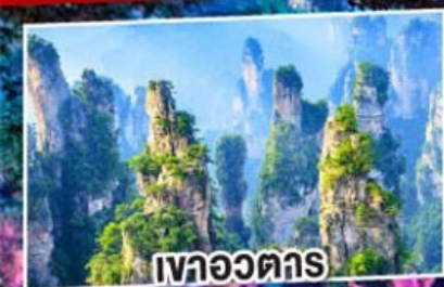
เวาอวตาร