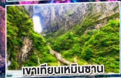
เวาเทียนเหมินซาน