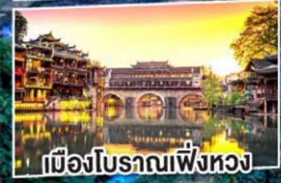
เมืองโบราณเฟิ่งหวง