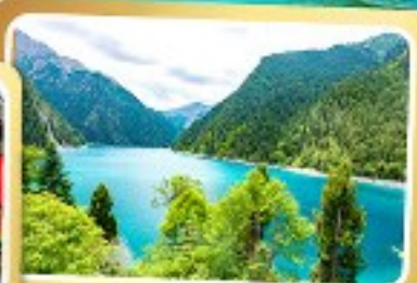
ทะเลสาบยาว