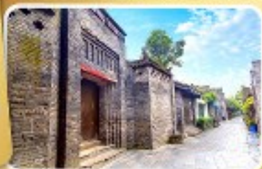
ถนนโบราณซอยกว้างซอยแคบ