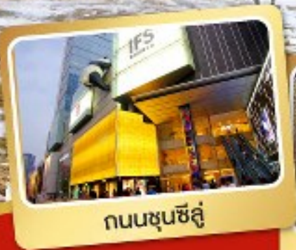
ถนนชุนชิลู่