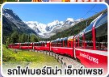
รถไฟเบอร์นีนา เอ็กซ์เพรส