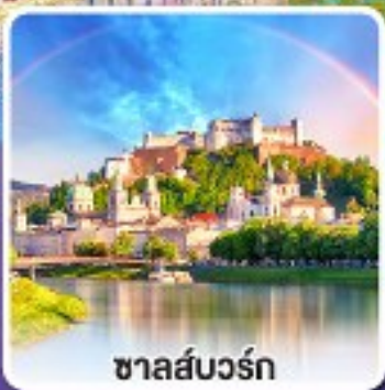
ซาลส์บวร์ค

ขึ้นรถไฟสายโรแมนติก เบอร์นีนา เอ็กซ์เพรส ชมวิวตระการตาของสวิส