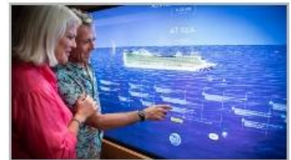
Events On Board