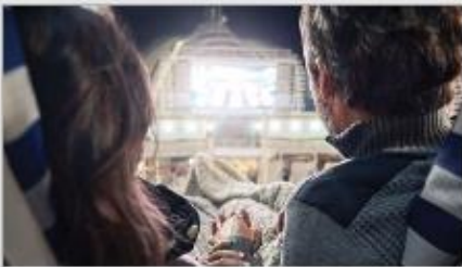
Movies Under the Stars®

Original musicals, dazzling magic shows, feature films, top comedians and nightclubs that get your feet movin' and groovin'. There's something happening around every corner; luckily, you have a whole cruise of days and nights to experience it all. 1