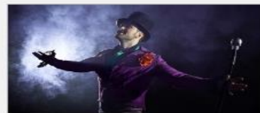
Featured Guest Entertainers