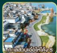
ทะเลสาบเอ๋อไห่คัง S