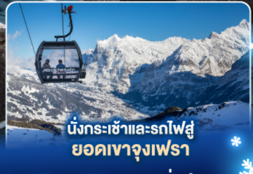
นั่งกระเช้าและรถไฟสู่ ยอดเขาจุงเฟรา