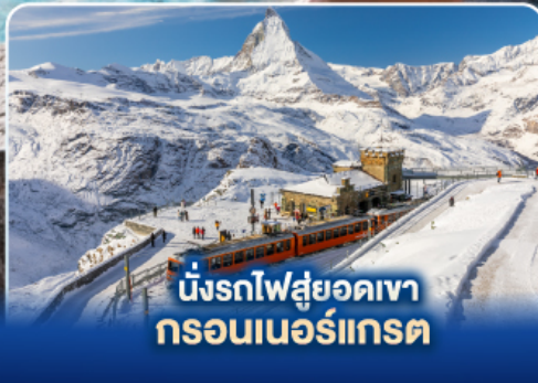
นั่งรถไฟสู่ยอดเขา กรอนเนอร์เกรต