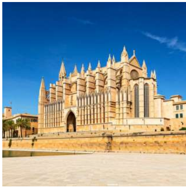
Palma de Mallorca:

Catedral de Mallorca: มหาวิหารปาล์มา เด มายอร์กา สถาปัตยกรรมโกธิคที่สวยงามตระการตา ภายในมีกระจกสีสวยงามและโคมไพร์ขนาดใหญ่