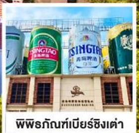
พิลเบียร์ที่เบียร์ชิงเต่า