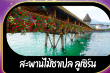
สะพานไม้ชาเปล คุชชิน