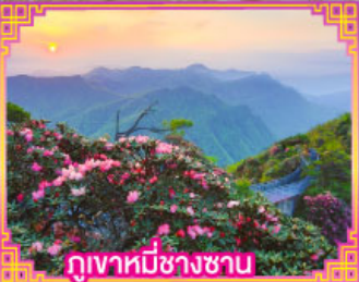
ภูเขาหิมะชางซาน