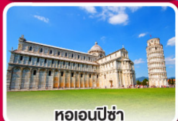
หอเอนปิซา