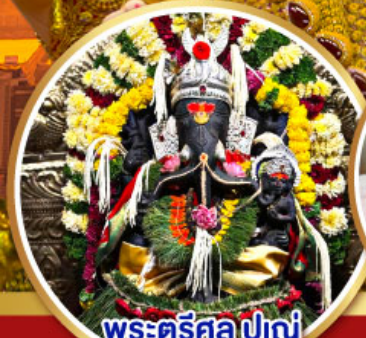
พระตรีศูล ปูणे (Trishul Pune)