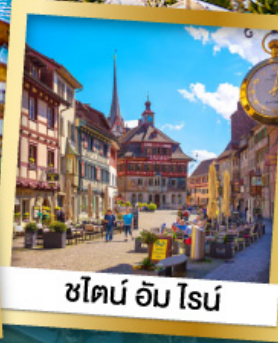
ชไตน์ อัม โรส