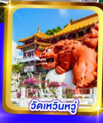
วัดเหวินหวู่