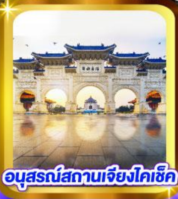
อนุสรณ์สถานเจียงไคเช็ค