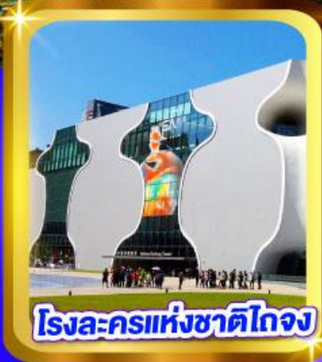
โรงละครแห่งชาติไทจง