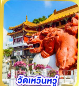
วัดเหวินหวู่