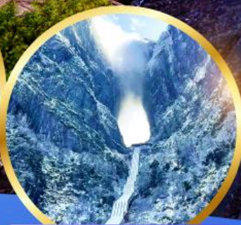
ประตูสวรรค์ เขียนเหมินซาน