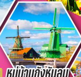
หมู่บ้านกังหันลม ชาสคินส์