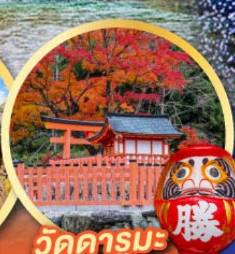
วัดคารุมะ