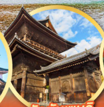
วัดนินเซนจิ