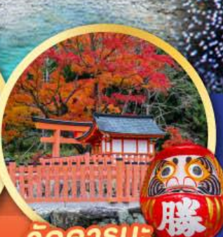
วัดคารุมะ