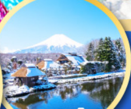
หมู่บ้านน้ำใส ไอชิโนะอัทสึ