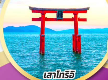
เสาโทริอิ