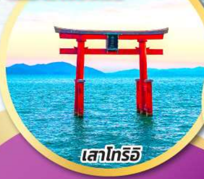
เสาโทริอิ