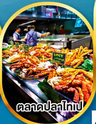
ตลาดปลาไทเป