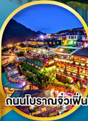
ถนนโบราณจิวเฟิ่น