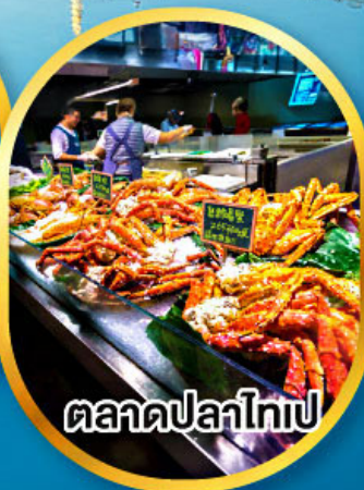
ตลาดปลาไทเป