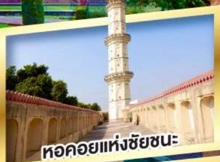
หอคอยแห่งชัยชนะ