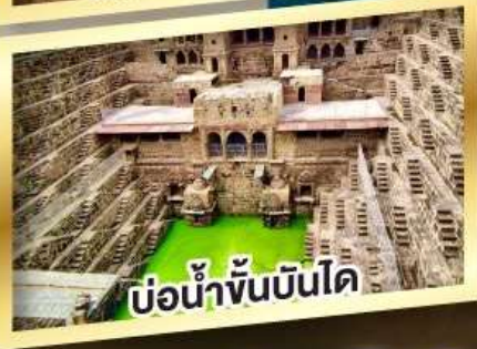
บ่อน้ำขั้นบันได