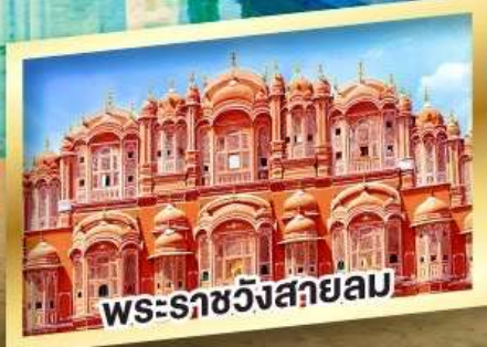
พระราชวังสายลม