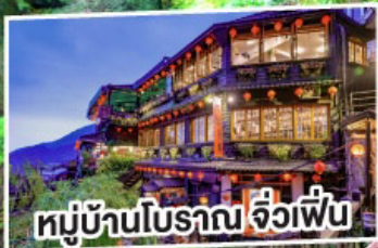
หมู่บ้านโบราณ จ๊วเพื่อน