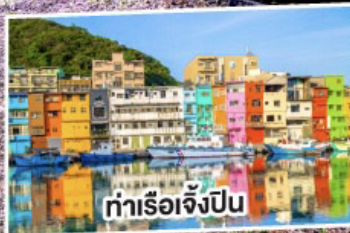
ท่าเรือเจ๋งป็น