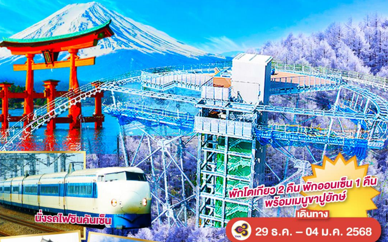
ขบวนรถไฟชินคันเซ็น

พักโตเกียว 2 คืน พักออนเซ็น 1 คืน พร้อมเมนูจายุกิชี่ เดินทาง