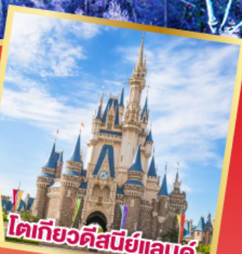
โตเกียวดิสนีย์แลนด์

อิสระท่องเที่ยว 1 วันเต็มในโตเกียว หรือซื้อทัวร์เสริม Tokyo Disneyland