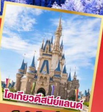
โตเกียวดิสนีย์แลนด์

อิสระท่องเที่ยว 1 วันเต็มในโตเกียว หรือซื้อทัวร์เสริม Tokyo Disneyland