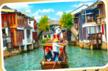
ล่องเรือเมืองโบราณจูเจียเจียว