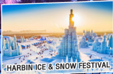
HARBIN ICE & SNOW FESTIVAL