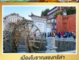
เมืองโบราณแชนกรีล่า