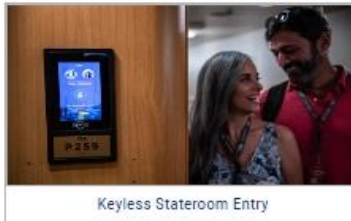
Keyless Stateroom Entry