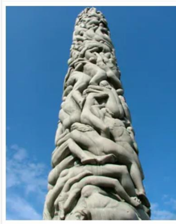
Oslo , Norway