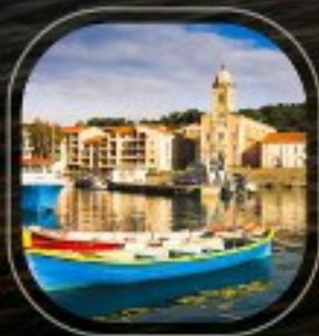
France Port Vendres