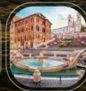
Italy Civitavecchia (Rome)

หมายเหตุ : ค่าตั๋วเครื่องบิน, ค่าประกันภัย, ค่าการยกใบขึ้นเครื่องสำหรับไทย | ราคาไม่รวม : ค่าค่าตัว, ค่าเครื่องดื่ม, ค่าขนถ่ายสัมภาระ