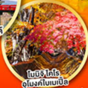
โชมิจิ ไคโร อุโมงค์ไบเมเปิล

เที่ยวเต็มทุกวัน ไม่มีฟรีคีย์ พักออนเซ็น 2 คืน พักโตเกียว 1 คืน บินเข้านาโงย่า-ออกโตเกียว