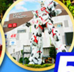
อิสระท่องเที่ยว 1 วันเต็ม